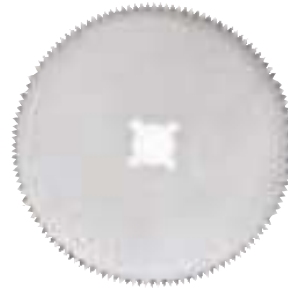
40.50.69 Ø 65 mm

Segmentsägeblatt Segmental saw blade Hoja de sierra de segmento Lame de scie en segments Lama de sega segmento