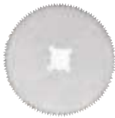
40.50.68 Ø 50 mm

Sägeblätter für Naturgipsverband Saw blades for plaster dressing Hojas de sierra para vendajes de yeso natural Lames de scie pour bandage en plâtre naturel Lame da sega per bendaggi in gesso naturale